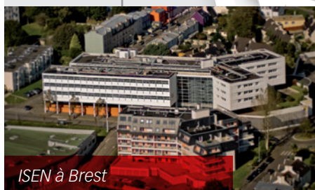
ISEN à Brest