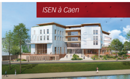
ISEN à Caen