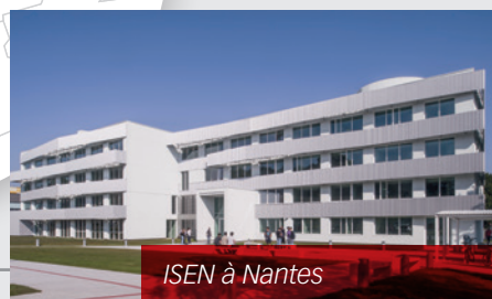
ISEN à Nantes