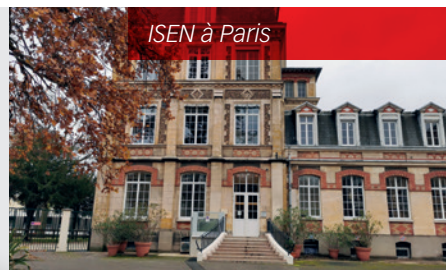
ISEN à Paris