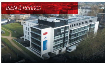
ISEN à Rennes