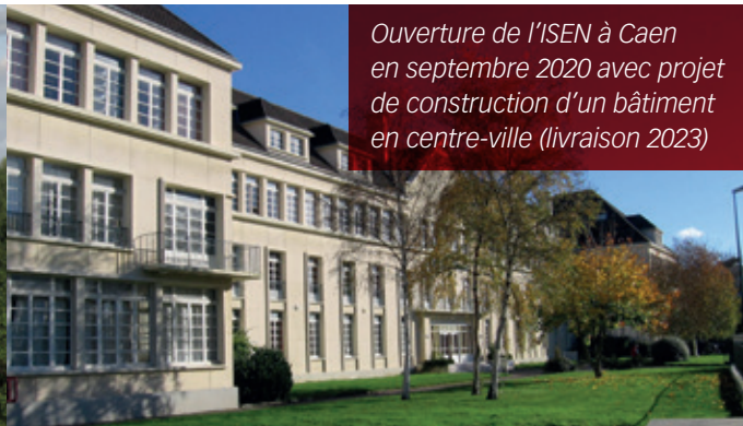
Ouverture de l'ISEN à Caen en septembre 2020 avec projet de construction d'un bâtiment en centre-ville (livraison 2023)