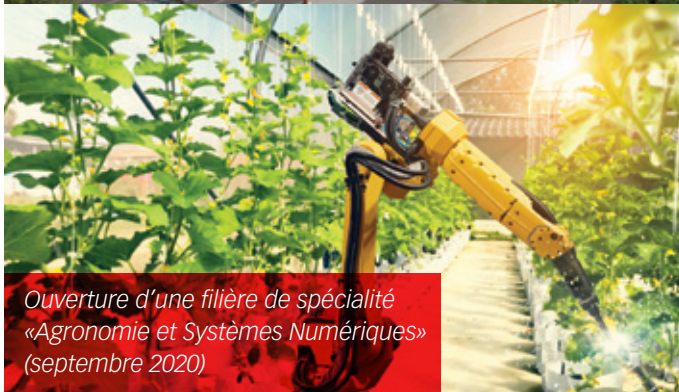
Ouverture d'une filière de spécialité «Agronomie et Systèmes Numériques» (septembre 2020)