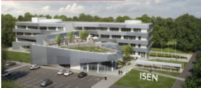
Construction d'un bâtiment à Nantes (rentrée 2021)